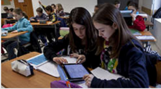
Rédaction de poème sur tablette lors d'un cours de français en classe de 6e au collège de Sèvres (92).