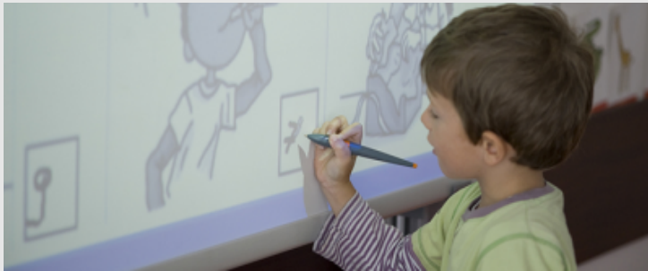
École élémentaire St Exupery (LevalloisPerret - 92). Classe de CP. Cours d'anglais avec tableau blanc interactif (TBI).