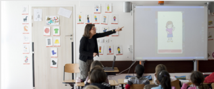
École élémentaire St Exupery (LevalloisPerret - 92). Classe de CP. Cours d'anglais avec tableau blanc interactif (TBI).