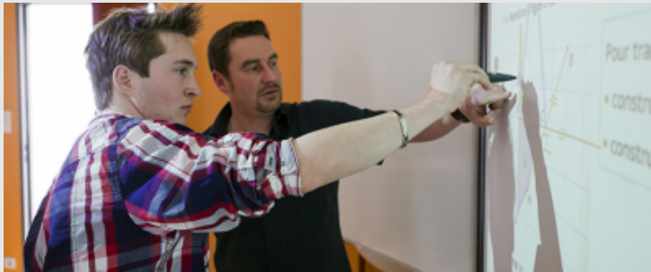
Cours de mathématiques sur TBI (Tableau Interactif) avec une classe seconde au lycée Professionnel Louis Marchal de Molsheim (67).