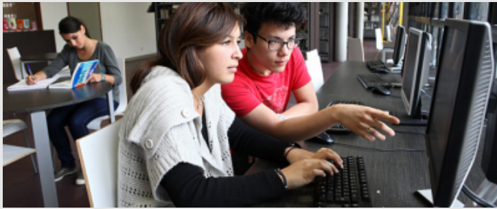
Élèves de classe de première au CDI du lycée Prévert à BoulogneBillancourt (92).