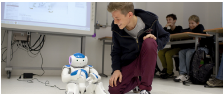
Au collège de Sèvres (92), découverte du robot NAO en classe de 4e.