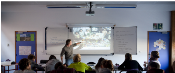
Cours de Géographie pour des élèves en classe de seconde au lycée du Diois de Die (26).