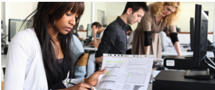
Classe de Terminale STG 6 Cours de Marketing Lycée Prévert - BoulogneBillancourt