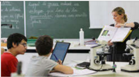
Elèves de 6e TP de SVT Collège Buffon - Paris