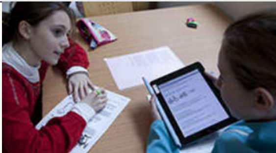
Élèves de collège au CDI avec une tablette numérique.