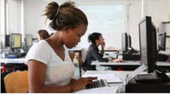
Classe de Terminale STG 6 Cours de Marketing Lycée Prévert - BoulogneBillancourt